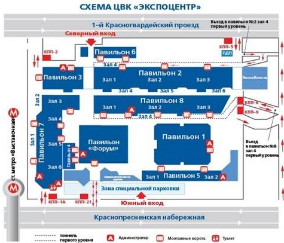
СХЕМА ЗОНЫ СПЕЦИАЛЬНОЙ ПАРКОВКИ